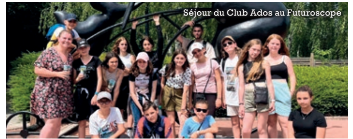
Séjour du Club Ados au Futuroscope

Cette volonté d'accessibilité aux loisirs pour les jeunes est également appliquée pour les séjours avec une participation financière importante de la commune, pouvant aller jusqu'à 60% du prix du séjour, réduisant ainsi le coût pour les familles concernées. ■