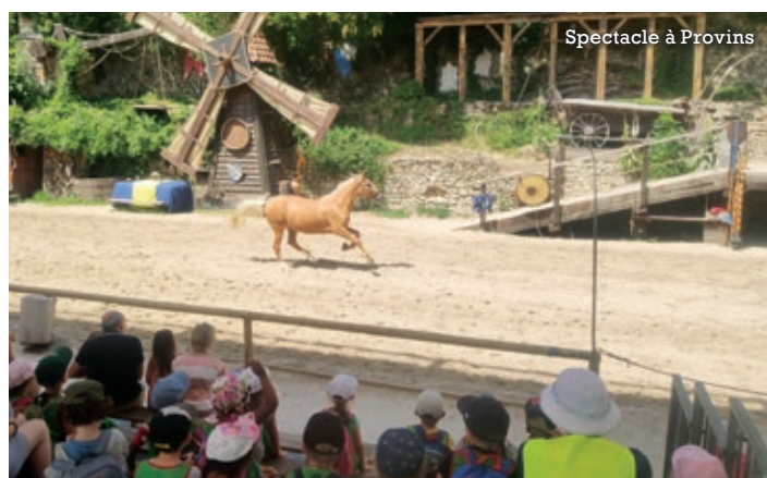
Spectacle à Provins

Le service enfance/jeunesse espère que les enfants ont bien rechargé leur batterie et leur souhaite une belle rentrée scolaire. ■