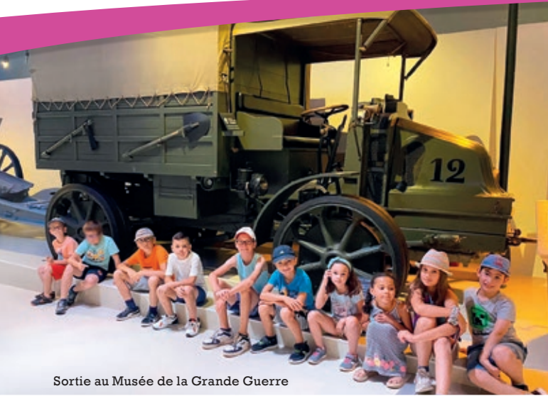
Sortie au Musée de la Grande Guerre