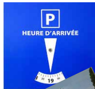
Disque de stationnement offert par la Municipalité