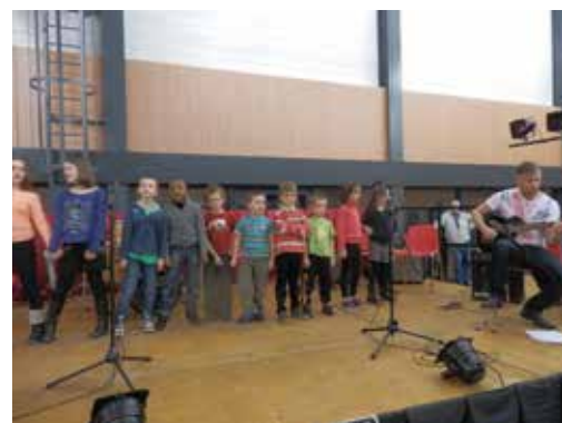
Intermède du conservatoire municipal de musique très apprécié par le public

Pour que notre pays retrouve la confiance de chacun, il faut que la justice fiscale et la justice sociale renouent avec les vraies valeurs d'une République nouvelle basée sur l'équité, l'honnêteté et le juste partage des efforts.