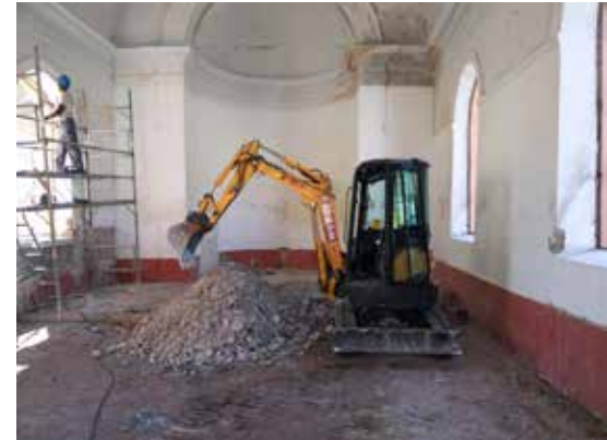
Le Temple au début des travaux

Le temple a fait l'unanimité quant à la qualité de sa rénovation intérieure : reprise du sol, isolation et doublage des murs et du plafond, nouvelles fenêtres, réfection de l'électricité, du chauffage et de l'éclairage.