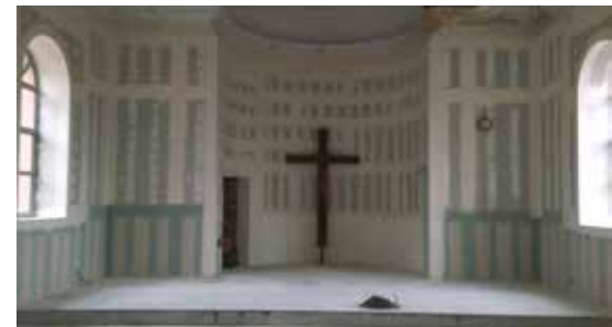
Isolation et doublage des murs et du plafond