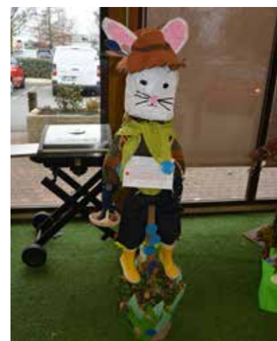
Le fameux Toupi de l'école maternelle de la Forestière décroche le 2 ème prix !

Ce sont 11 épouvantails qui ont été exposés à Jardiland la semaine du 14